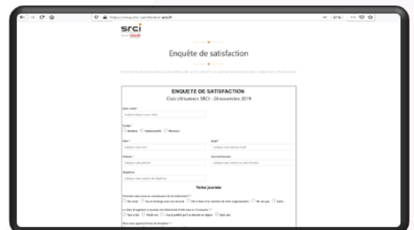
Personnalisation des formulaires à votre image