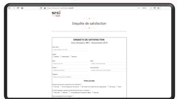
Personnalisation des formulaires à votre image